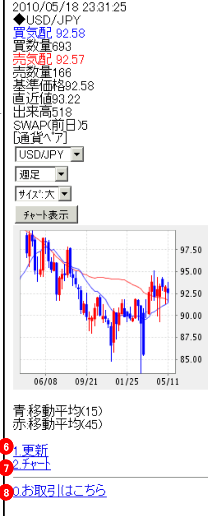
[チャート閲覧画面]